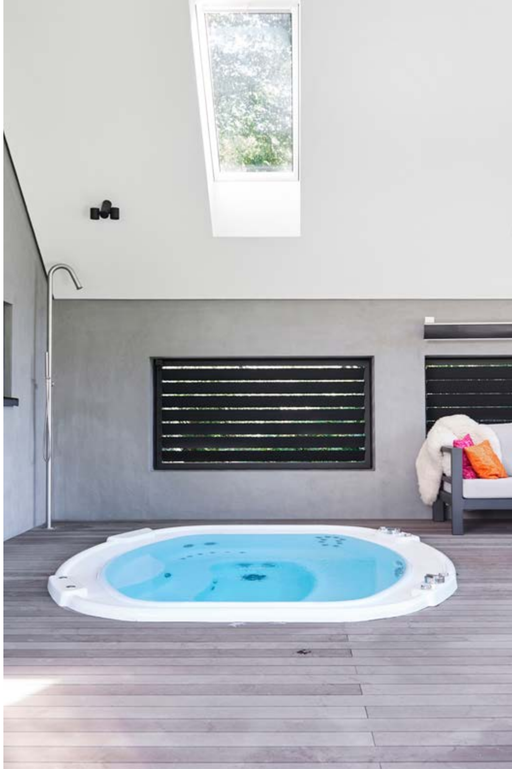
Het overdekte terras met glazen dak is een uitbreiding van de oorspronkelijke woning. De planken van composiet van Estec zijn duurzaam en ververen niet. Naast de ingebouwde jacuzzi staat een douche van Luca Sanitair. Rond de tafelgashaard staat een grote loungebank. Vanaf dit terras ligt een paar treden lager het buitenzwembad.